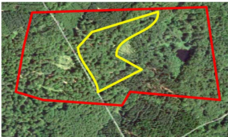
Figur 2. Eksempel på afgrænsning af levested for sortspætte. Besøgsarealet (rød linje) er afgrænset ud fra orthofoto, men i felten vurderes at kun en mindre del opfylder artens levestedskrav (gul linje).

Ved afgrænsningen af levestedet indtegnes kun det centrale redeområde med tilstedeværelse af potentielle redetræer. Størrelsen af redeområdet vil variere alt efter skovstrukturen og det samlede skovareal, men vil typisk omfatte centrale, relativt uforstyrrede dele af skoven, af minimum 2-400 m i udstrækning.