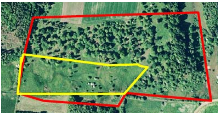
Figur 4. Eksempel på afgrænsning af potentielt levested for hedelærke. Besøgsarealet (rød linje) er afgrænset ud fra orthofoto, men i felten vurderes at kun en mindre del opfylder artens levestedskrav (gul linje).

Ved afgrænsningen af levestedet indtegnes hele det egnede område, bestående af både redeområdet og fødesøgningsområdet. Størrelsen af levestedet vil variere, og kan omfatte flere egnede territorier, dog skal arealet minimum være 2-400 m i udstrækning.