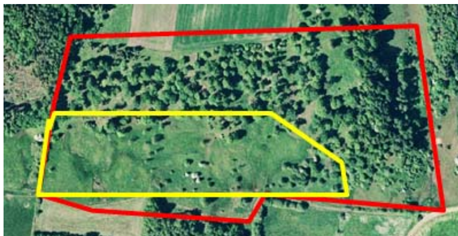
Figur 3. Eksempel på afgrænsning af potentielt levested for rødrygget tornskade. Besøgsarealet (rød linje) er afgrænset ud fra orthofoto, men i felten vurderes at kun en mindre del opfylder artens levestedskrav (gul linje).

Ved afgrænsningen af levestedet indtegnes hele det egnede område, bestående af både redeområdet og fødesøgningsområdet. Størrelsen af levestedet vil variere, og kan omfatte flere egnede territorier (gennemsnitlig territoriestørrelse er ca. 1,5 ha), dog skal arealet minimum være 2-400 m i udstrækning. Landbrugsarealer i omdrift er ikke en del af levestedet for rødrygget tornskade.