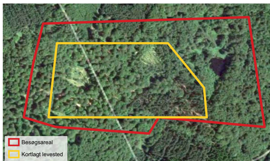
Figur 1. Eksempel på afgrænsning af levested for hvepsevåge. Besøgsarealet (rød linje) er afgrænset ud fra orthofoto, men i felten vurderes at kun en mindre del opfylder artens levestedskrav (gul linje).

Ved afgrænsningen af levestedet indtegnes kun det eller de centrale redeområder. De omkringliggende skovarealer, herunder mindre skove i nærheden danner tilsammen det samlede fødesøgningsområde. Størrelsen af det kortlagte redeområde vil variere alt efter skovstrukturen og det samlede skovareal, men vil typisk omfatte de centrale, relativt uforstyrrede dele af skoven, af minimum 4-500 m i udstrækning med åbent kronedække og gerne med større, gamle træer. I større skove kan redeområdet være store sammenhængende områder eller flere mindre områder.