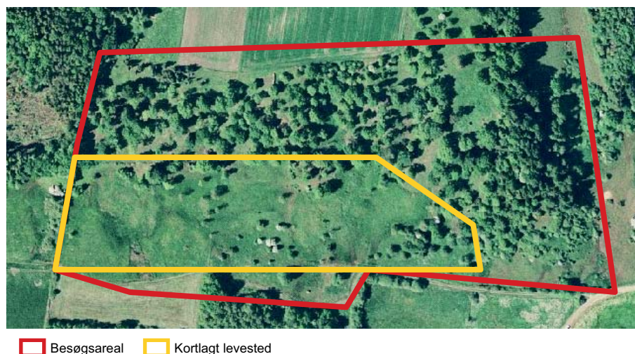
■ Besøgsareal ■ Kortlagt levested