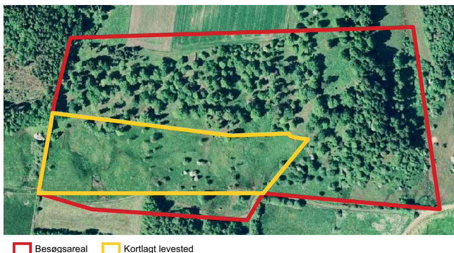
Figur 4. Eksempel på afgrænsning af potentielt levested for hedelærke. Besøgsarealet (rød linje) er afgrænset ud fra orthofoto, men i felten vurderes at kun en mindre del opfylder artens levestedskrav (gul linje).

Ved afgrænsningen af levestedet indtegnes hele det egnede område, bestående af både redeområdet og fødesøgningsområdet. Størrelsen af levestedet vil variere, og kan omfatte flere egnede territorier, dog skal arealet minimum være 2-400 m i udstrækning.