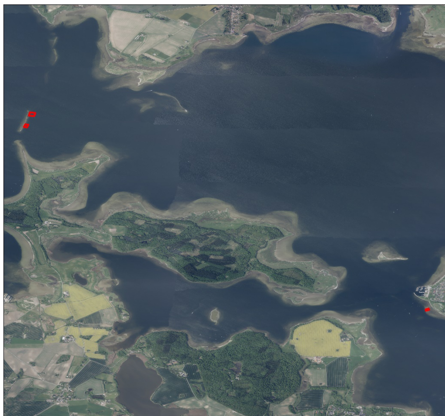
Figur 1.1. Forslag til placering af naturgenopretningsrev ved Nørrerev (områder markeret med rødt til venstre) og formidlingsrevet ved Veddelev (området markeret med rødt til højre).

Formidlingsrevet ud for campingpladsen ud for Veddelev ( figur 1.1 ) blev identificeret ud fra følgende kriterier: