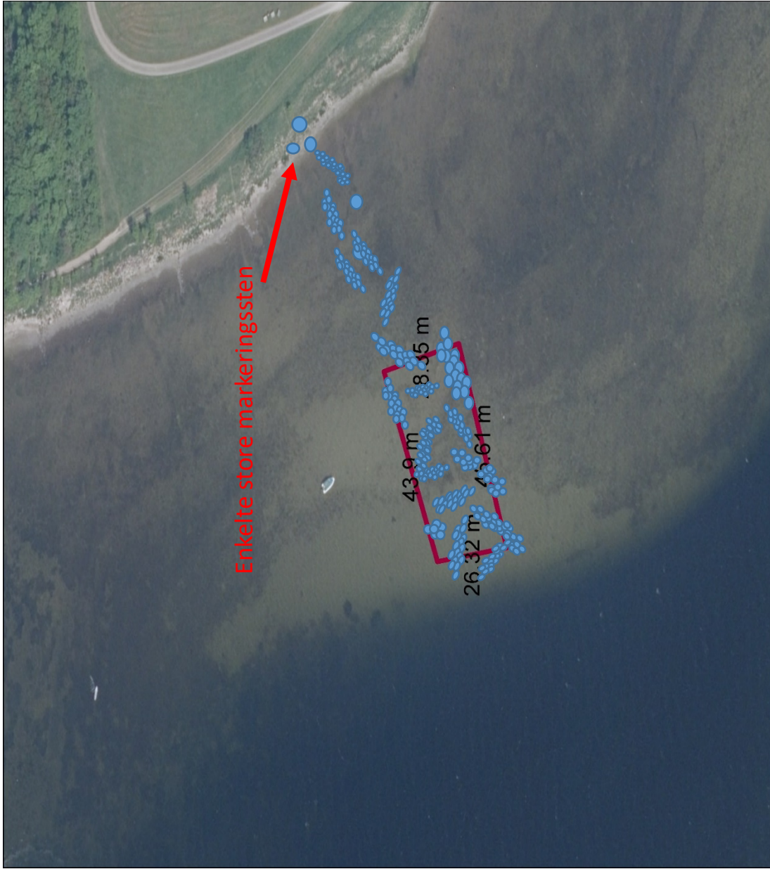
Figur 3.1. Forslag til detailplan for udlægning af sten ved formidlingsrevet ud for campingpladsen ved Veddelev.

Materiale: natursten > 100 cm i diameter.